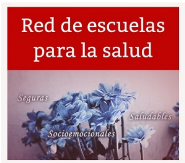
Imagen del Recurso

https://www.educacion.navarra.es/web/dpto/red-de-escuelas-para-la-salud