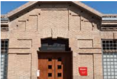
Imagen del Recurso

http://www.zaragoza.es/sede/portal/derechos-sociales/personas-mayores/