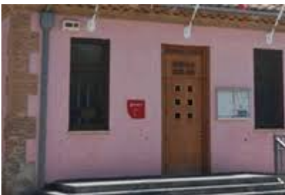
Imagen del Recurso

http://www.zaragoza.es/sede/portal/derechos-sociales/personas-mayores/