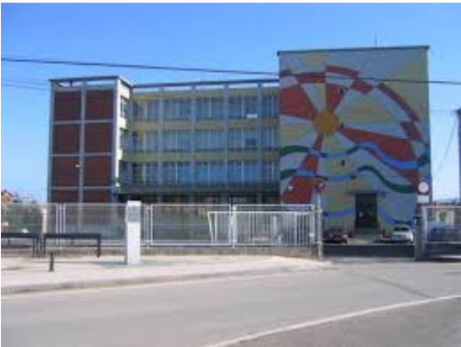
Imagen del Recurso