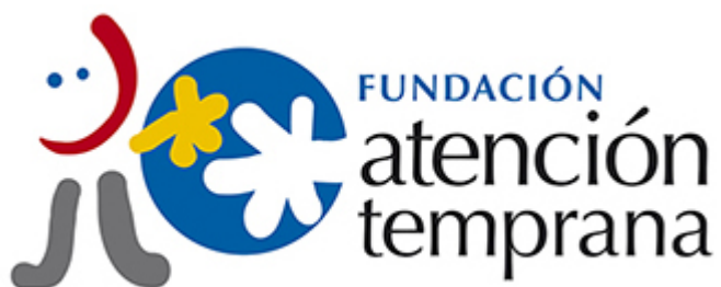
Imagen del Recurso

http://www.atenciontemprana.org http://www.zonazpsicologiajuvenil.org https://www.facebook.com/FAT.aragon/