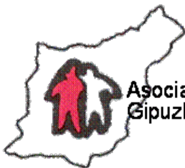
Imagen del Recurso

Asociación Guipuzcoana de Hemofilia Gipuzkoako Hemofilia Elkarte