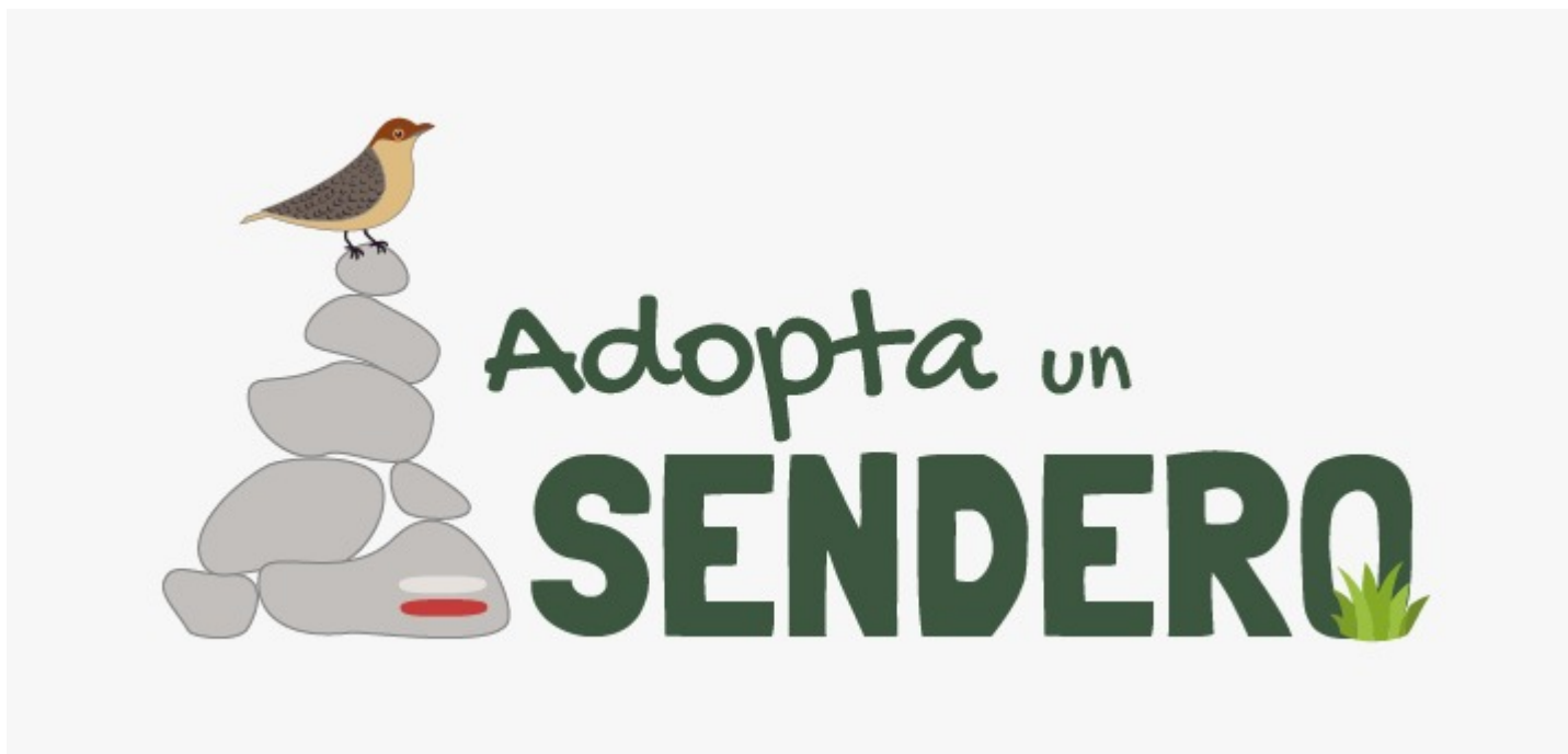
Imagen del Recurso

https://app.adoptaunsendero.org/dl/dcc150 http://@adoptaunsendero