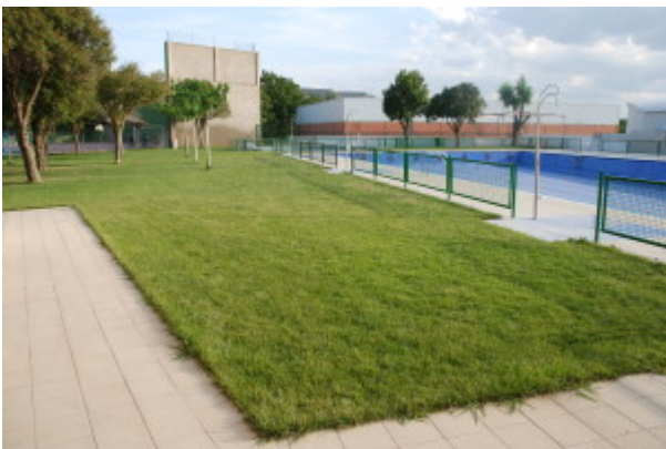
Imagen del Recurso

https://www.hijar.es/servicios/deportes/piscinas-municipales/