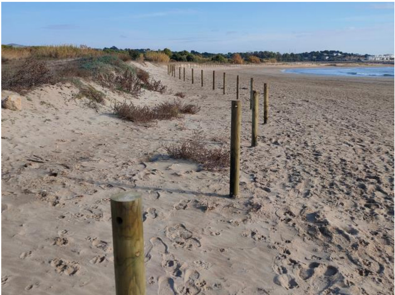
Imagen del Recurso

https://www.vilanovaturisme.cat/que_fer/platja_llarga