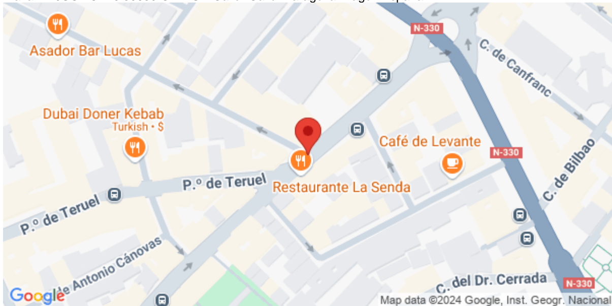
Imagen del Recurso

Plaza LA JUSTICIA 6 50650 GALLUR Gallur Gallur Zaragoza Aragón España