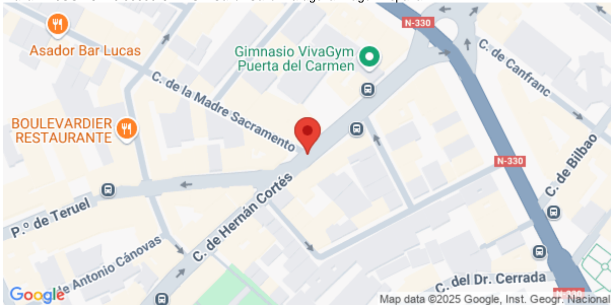
Imagen del Recurso

Plaza LA JUSTICIA 6 50650 GALLUR Gallur Gallur Zaragoza Aragón España