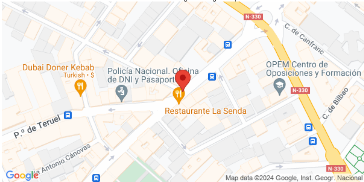
Imagen del Recurso

Plaza LA JUSTICIA 6 50650 GALLUR Gallur Gallur Zaragoza Aragón España