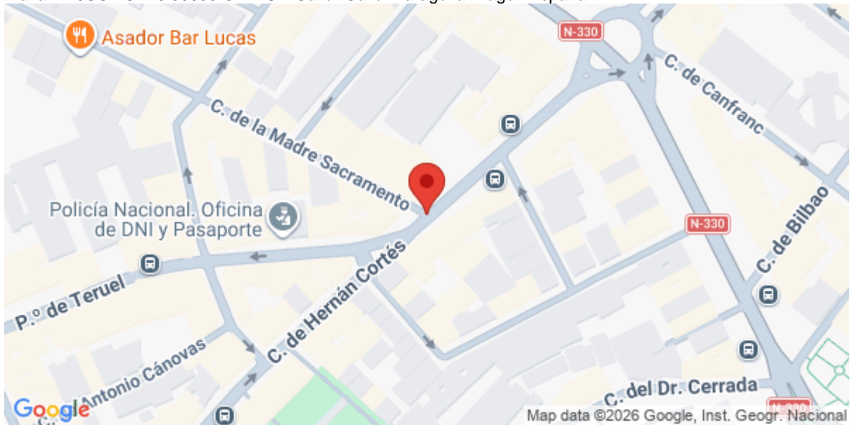
Imagen del Recurso

Plaza LA JUSTICIA 6 50650 GALLUR Gallur Gallur Zaragoza Aragón España