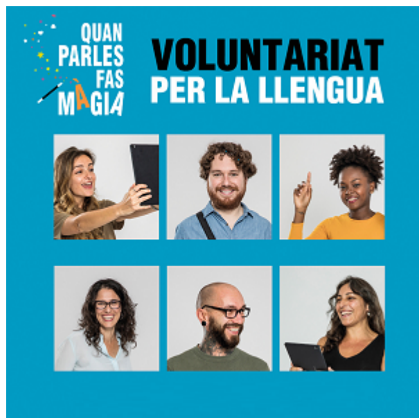
Imagen del Recurso