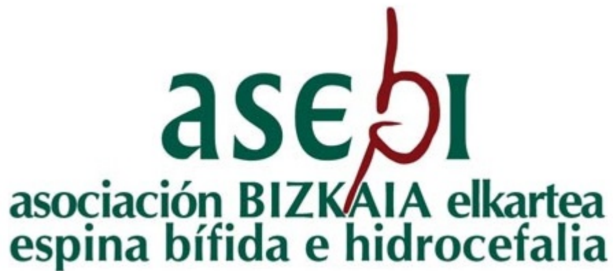
Imagen del Recurso