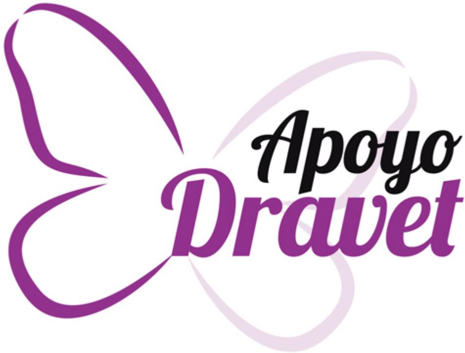
Imagen del Recurso