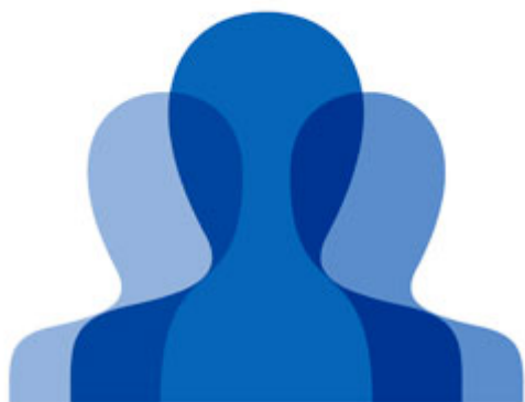
Imagen del Recurso