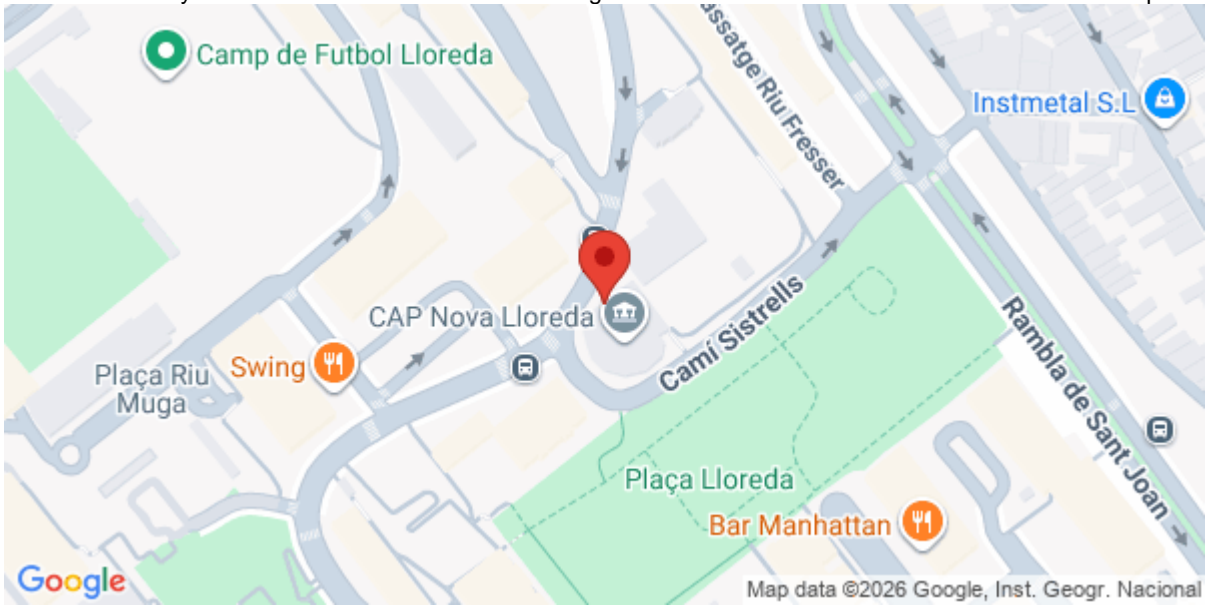
Imagen de la Actividad

Avenida Catalunya 62-64 08917 Badalona Casal Gent gran Nova Lloreda Badalona Barcelona Catalunya España