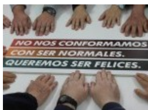
Imagen de la Actividad