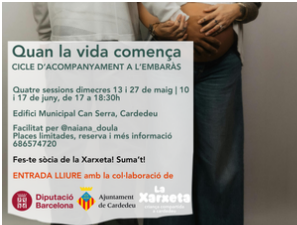
Imagen de la Actividad

https://docs.google.com/forms/d/e/1FAIpQLSc3OFX_1v_ue3-YIrUNKCY0QKUvdL16qvlqJ-8QiLjdro0Mjw/viewform?usp=sharing&oid=101820567608417182001