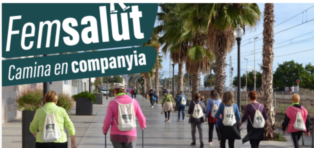
Imagen de la Actividad