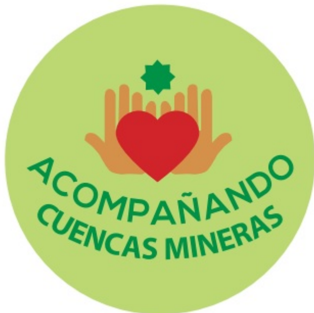
Imagen de la Actividad