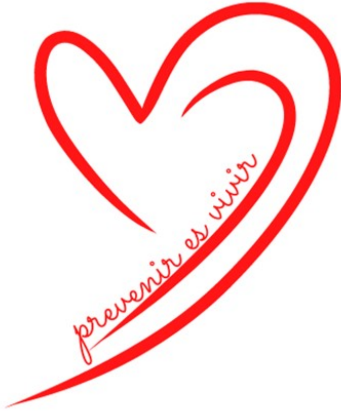
Imagen de la Actividad

https://www.facebook.com/caritasdiocesanabarbastromonzon/?locale=es_ES