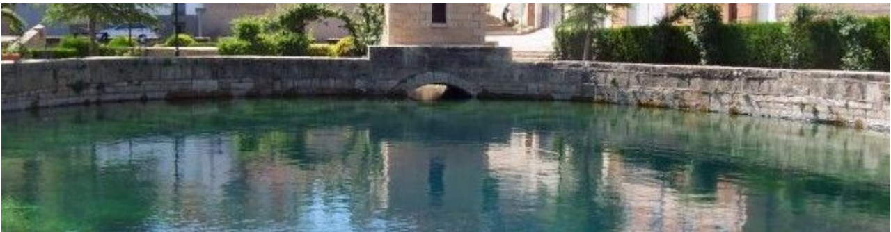
Imagen de la Actividad

https://www.cella.es/2023/06/cella-y-su-fuente/