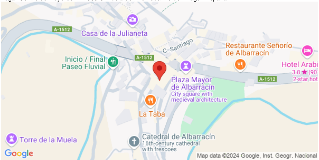
Imagen de la Actividad

Lugar Centro de mayores 1 44366 Orihuela del Tremedal Teruel Aragón España