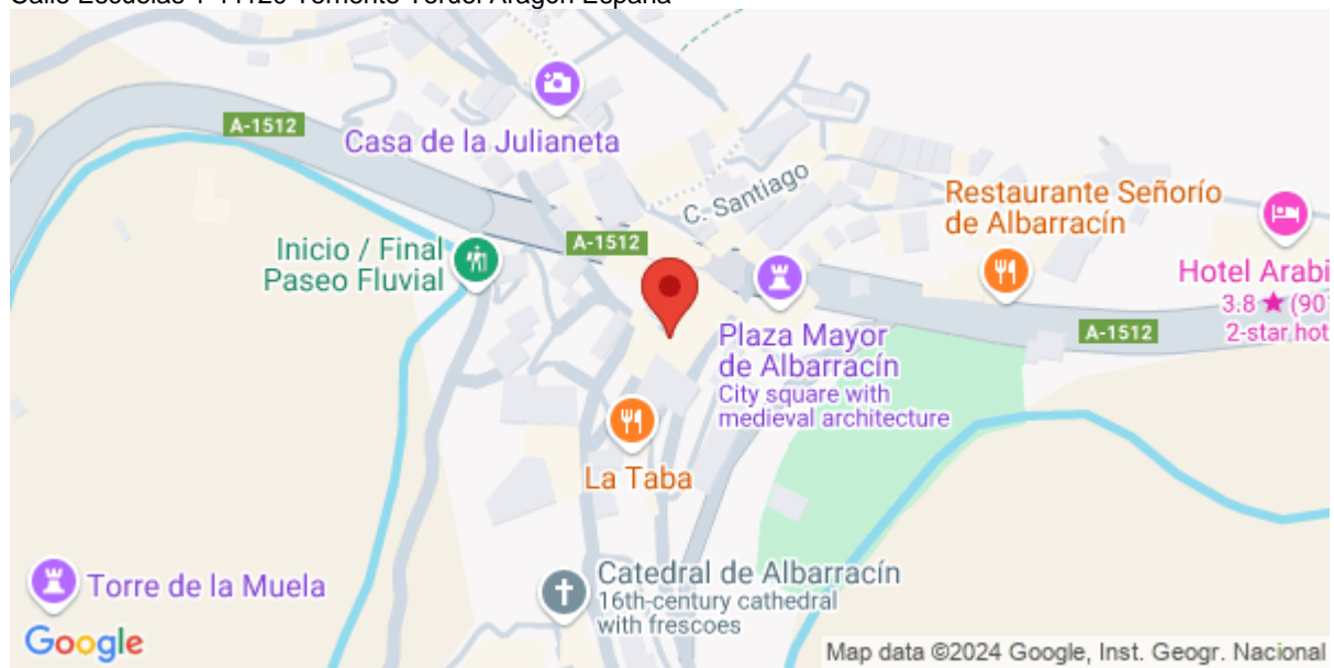
Imagen de la Actividad

Calle Escuelas 1 44120 Terriente Teruel Aragón España