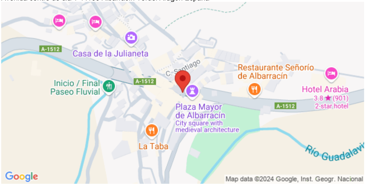
Imagen de la Actividad

Avenida centro de día 1 44100 Albarracín Teruel Aragón España