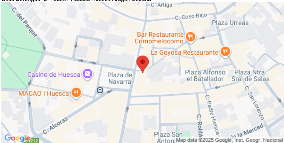
Imagen de la Actividad

Calle Berenguer 2-4 22001 Huesca Huesca Aragón España