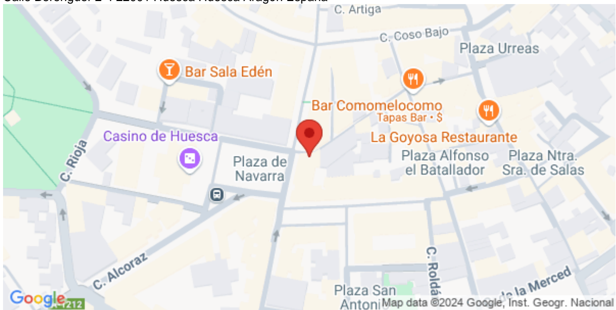
Imagen de la Actividad

Calle Berenguer 2-4 22001 Huesca Huesca Aragón España