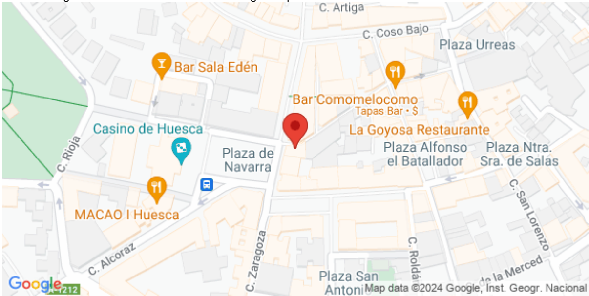
Imagen de la Actividad

Calle Berenguer 2-4 22001 Huesca Huesca Aragón España