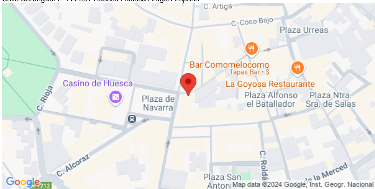
Imagen de la Actividad

Calle Berenguer 2-4 22001 Huesca Huesca Aragón España