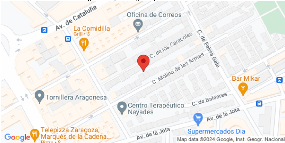
Imagen de la Actividad

Avenida de la JOTA 42 50014 Zaragoza Zaragoza Aragón España