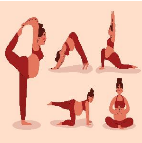
Imagen de la Actividad

https://santandreu.inscripcionscc.com/MiramModular/buscador/buscador.jsp?g=1&c=22&t=AC&f=0A&p=1