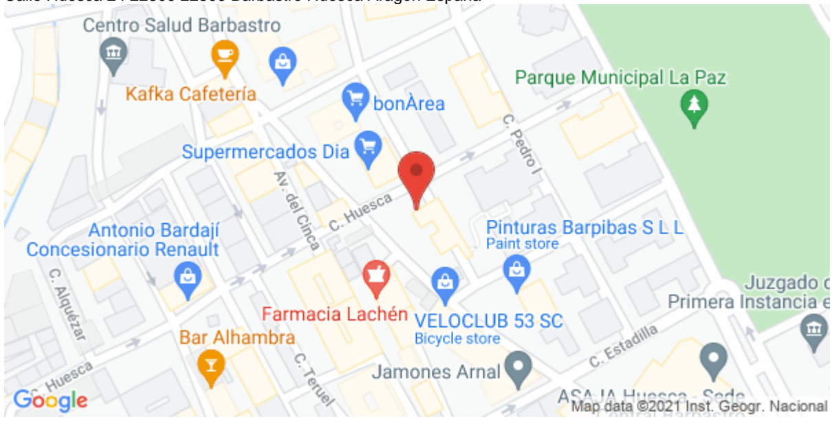
Imagen de la Actividad

Calle Huesca 24 22300 22300 Barbastro Huesca Aragón España