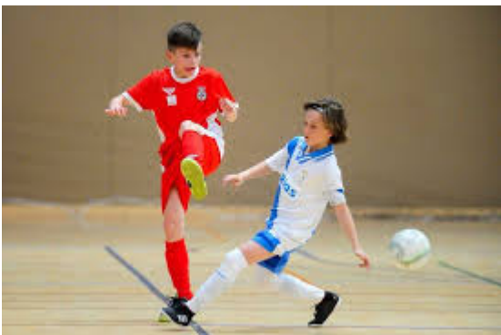
Imagen de la Actividad